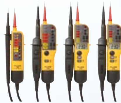
Snelle, veilige metingen