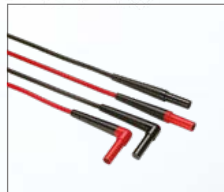
Fluke TL224 SureGrip™ Meetsnoeren met siliconenisolatie