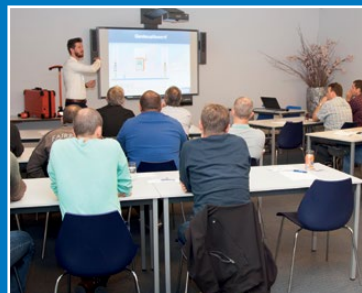
Seminars en workshops